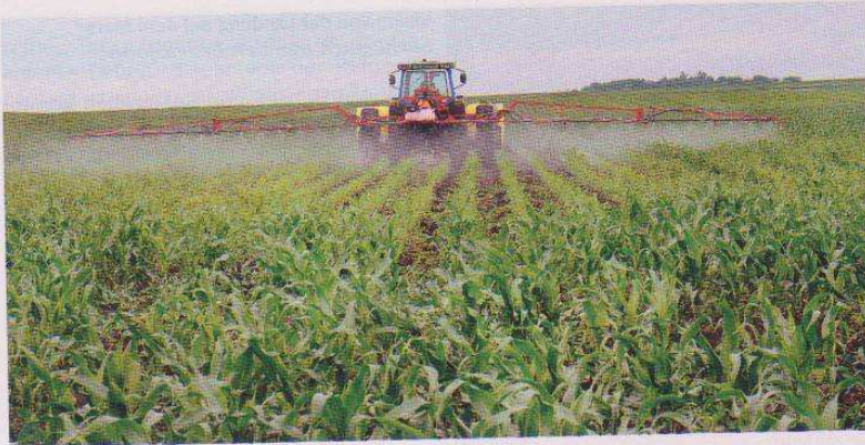
Versprühen von Glyphosat in den USA „Der Druck der Industrie ist enorm“